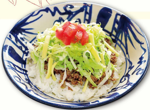
タコライス (ハーフサイズ)

タコライス (ハーフサイズ) + そば (小) Taco Rice (half size) + Soba (small size) セットのそばをお選びください