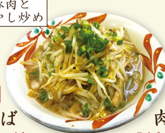
豚肉ともやし炒め