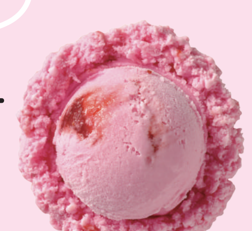
ストロベリー Strawberry 草莓 딸기