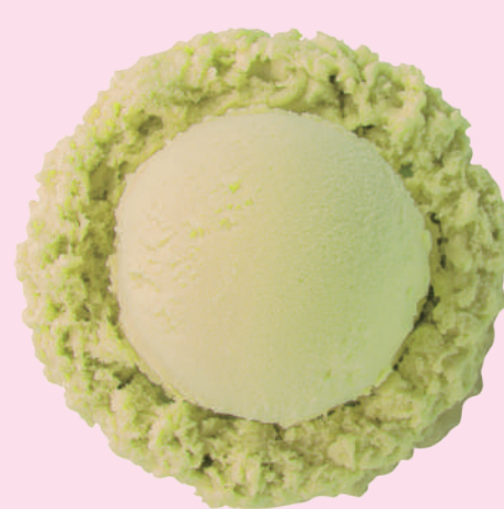
シークワサー Siquasa 扁頭檸檬 시과사