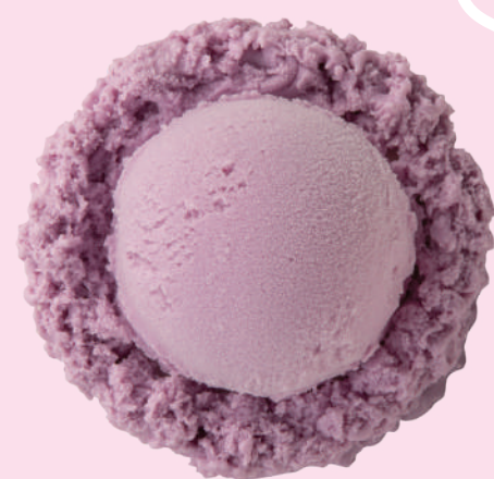
紅イモ Purple yam 紅薯 자색 고구마