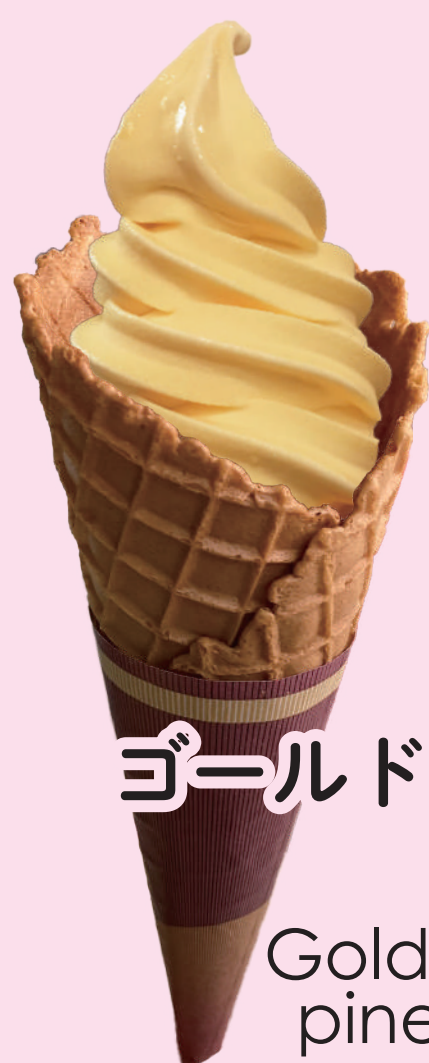
ゴールドバレル パイ Gold barrel pineapple 黄金菠萝冰激凌 파인 소프트 아이스크림