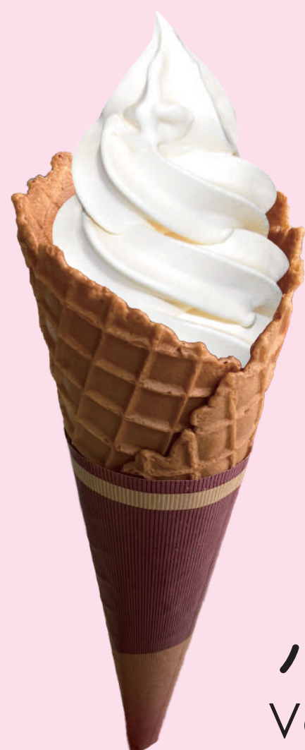
バニラ Vanilla 香草软冰淇淋 바닐라 소프트 아이스크림