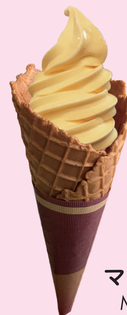
マンゴー Mango 芒果软冰淇淋 망고 소프트 아이스크림