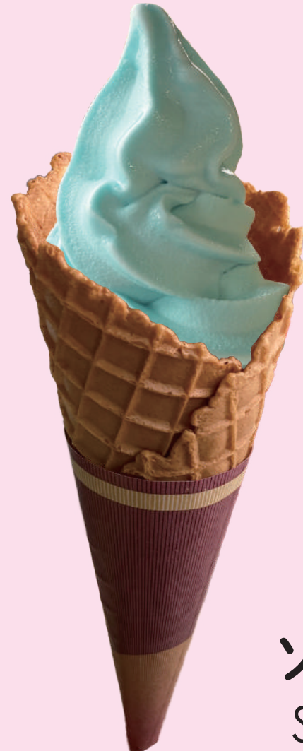
ソーダ Soda 苏打软冰淇淋 소다 소프트 아이스크림