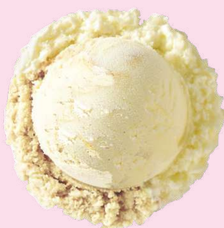
バニラ Vanilla 香草 바닐라