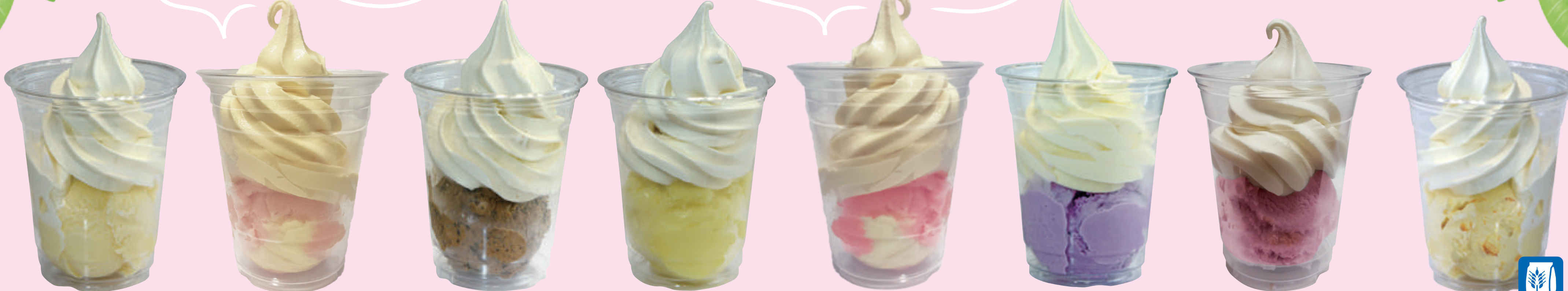
バニラ Vanilla 香草 바닐라