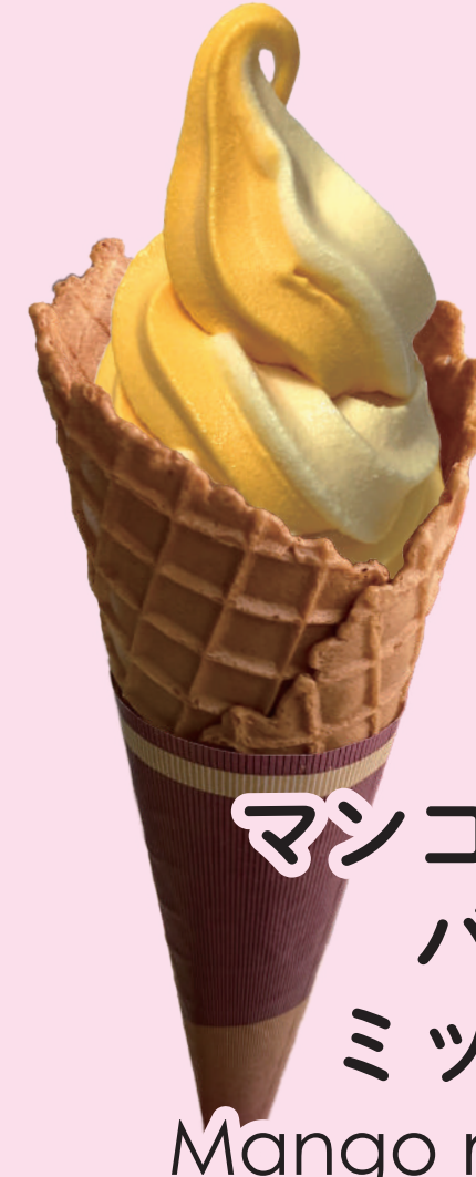
マンゴー& バニラ ミックス Mango mixed 香草芒果软冰淇淋 망고 바닐라 소프트 아이스크림