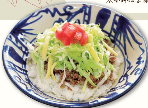
タコライス (ハーフサイズ)