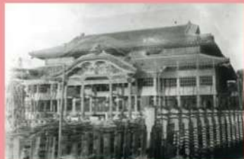
戰前的首里城正殿

據傳首里城建於14世紀左右，是一座融合了中日文化的琉球獨特城郭，曾是琉球王國最大的木造建築。首里城是國王及其家族居住的「王宮」，同時也是王國統治的行政機構「首里王府」的總部，此外，這裡也是被分派至各地神女們執行王國祭祀的宗教據點。1879年成為沖繩縣之後，首里城被作為日本軍隊的駐紮地和各種學校等使用。後於1945年的沖繩戰役中被燒