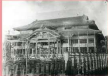
전쟁 전의 슈리성 정전(正殿)

14세기경 창건되었다는 슈리성은 중국과 일본의 문화도 혼합된 류큐 특유의 성으로, 류큐왕국 최대의 목조 건축물이었습니다. 슈리성은 국왕과 그 가족이 거주하는 '왕궁'인 동시에, 왕국의 통치 행정 기관인 '슈리 왕부'의 본부이기도 했습니다. 나아가 각지에 배치된 신관 여성들을 통해 왕국 제사를 운영하는 종교상의 네트워크 거점으로도 존재했습니다. 1879년, 오키나와현이 된 이후로 슈리성은 일본군의 주둔지이자 각종 학교 등으로 사용됐습니다. 1945년 오키나와