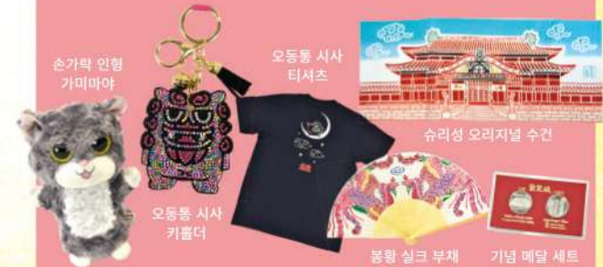
손가락 인형 가미야마

커피, 아이스크림 등 경식을 편하게 즐기실 수 있습니다. ☎ 9:00~18:00 경식 주문 마감 시간(17:30)