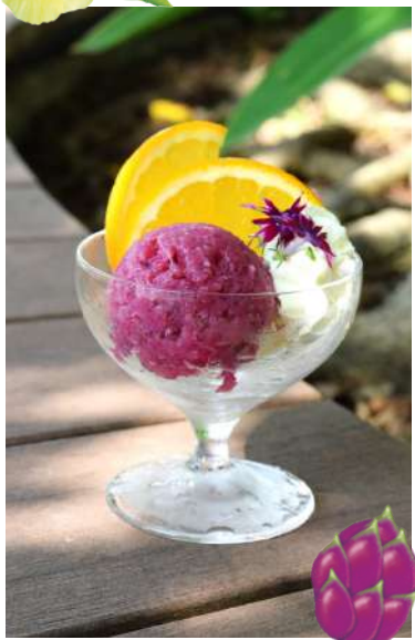
③⑦ドラゴンフルーツ ソルベ Dragon Fruit Sorbet