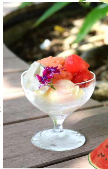
③⑨すいかソルベ Watermelon Sorbet