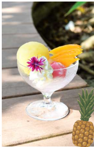
③⑧パインソルベ Pineapple Sorbet