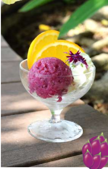
③⑦ドラゴンフルーツ ソルベ Dragon Fruit Sorbet