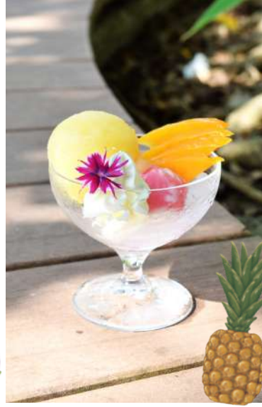
③⑧パインソルベ Pineapple Sorbet