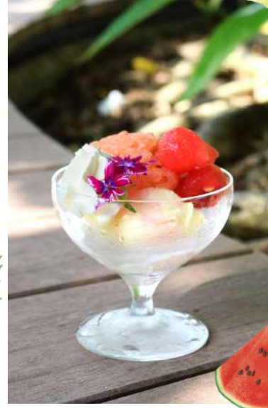
③⑨すいかソルベ Watermelon Sorbet