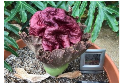
昨年の開花時の様子