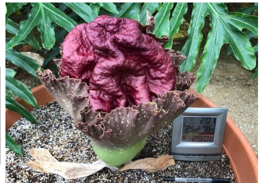
昨年の開花時の様子